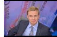
Kopfnuten für Politiker, Manager und Prominente